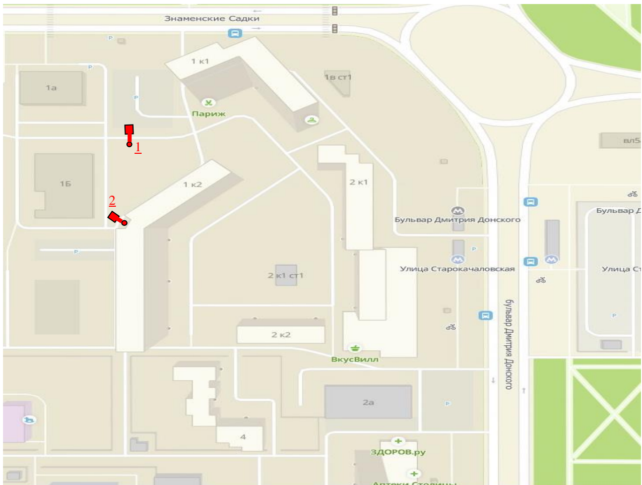
Схема размещения шлагбаумов:

1. Место размещения шлагбаумов: г. Москва, ул. Знаменские Садки д.1 корп.2, при въезде на придомовую территорию.